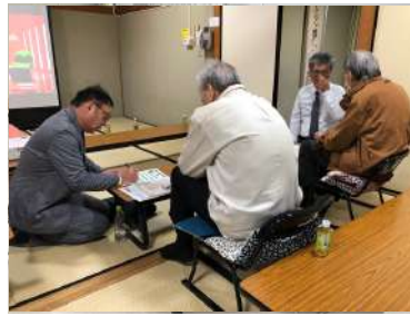
2025.12 西生涯学習センター