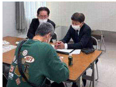
2026.3 守山生涯学習センター