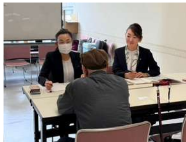
2026.4 レディヤンかすがい