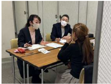
2026.3 スカイワードあさひ